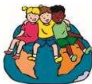
Blok 1 We horen bij elkaar