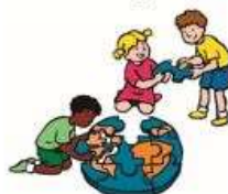
Blok 5 We dragen een steentje bij