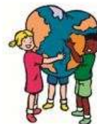
Blok 4 We hebben hart voor elkaar