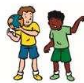
Blok 2 We lossen conflicten zelf op