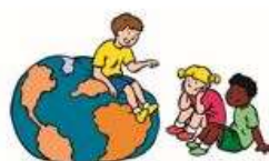
Blok 3 We hebben oor voor elkaar